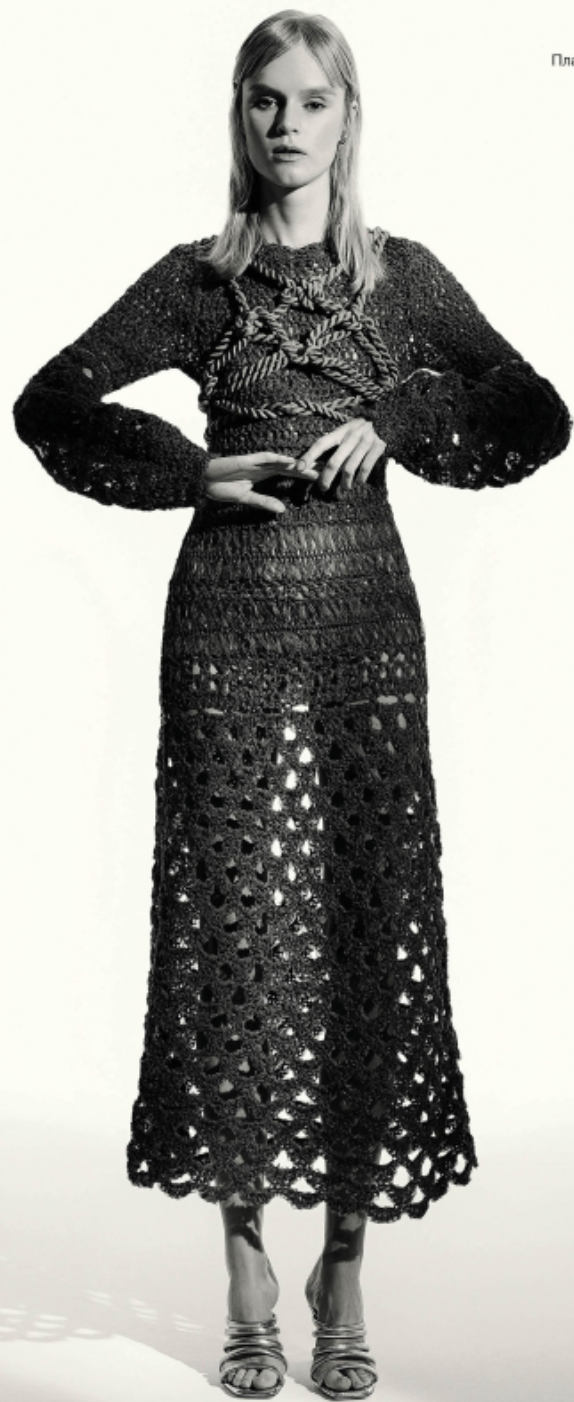
Платье: ALBERTA FERRETTI Обувь: POLLINI