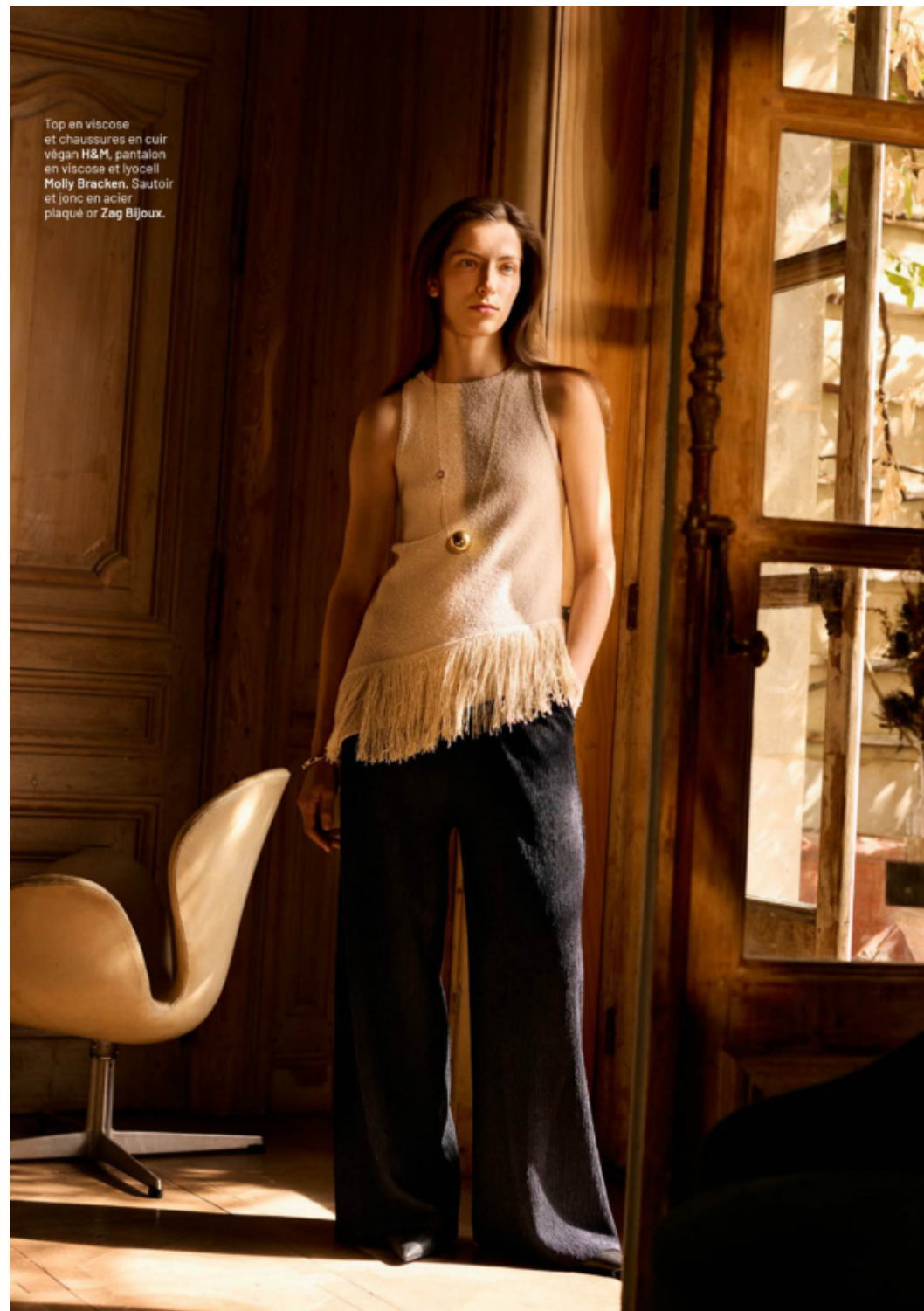
Top en viscose et chaussures en cuir végétal H&M , pantalon en viscose et lycell Molly Bracken , Sautoir et jonc en acier plaqué or Zag Bijoux .