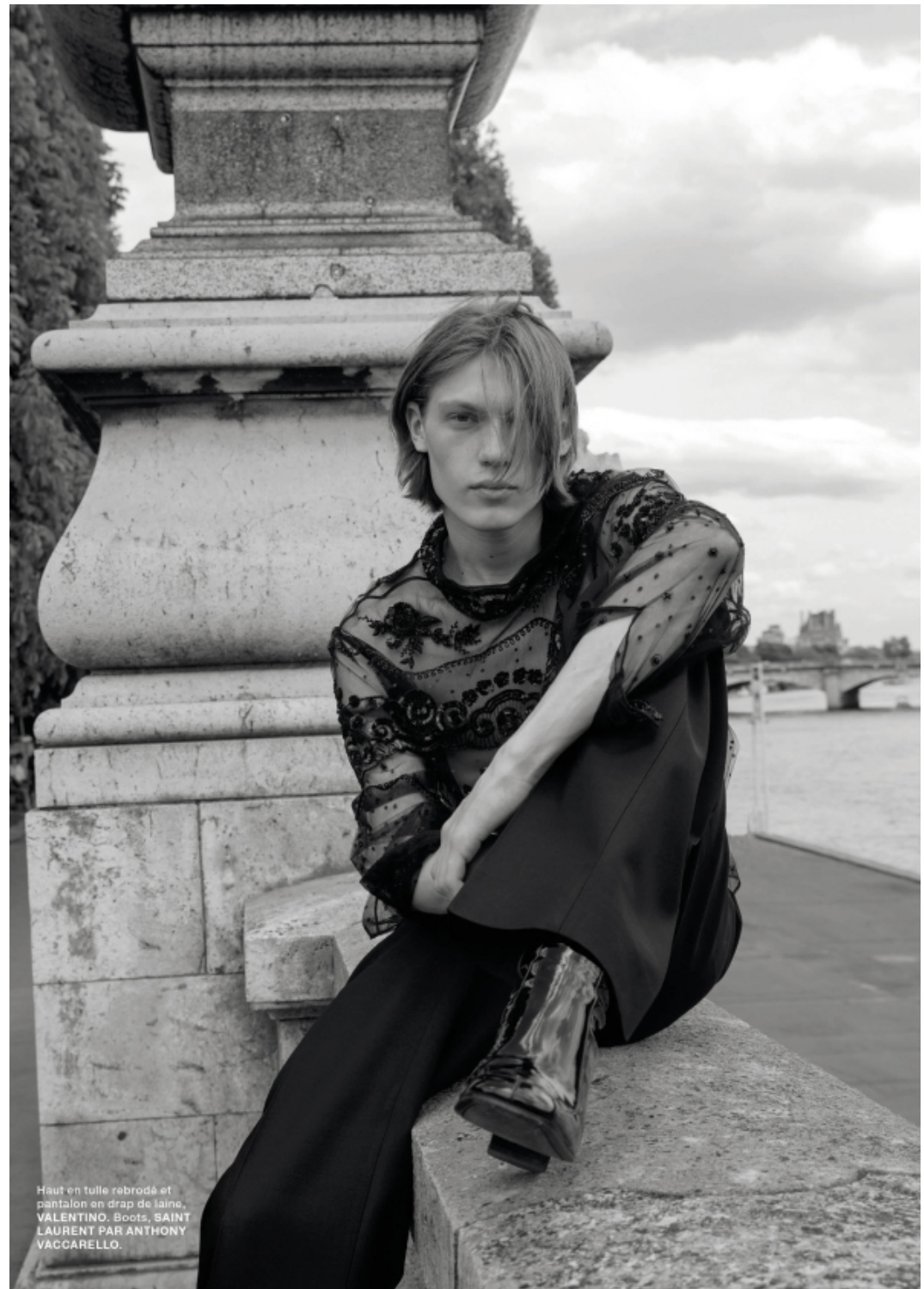
Haut en tulle rebrodé et pantalon en drap de laine, VALENTINO. Boots, SAINT LAURENT PAR ANTHONY VACCARELLO.