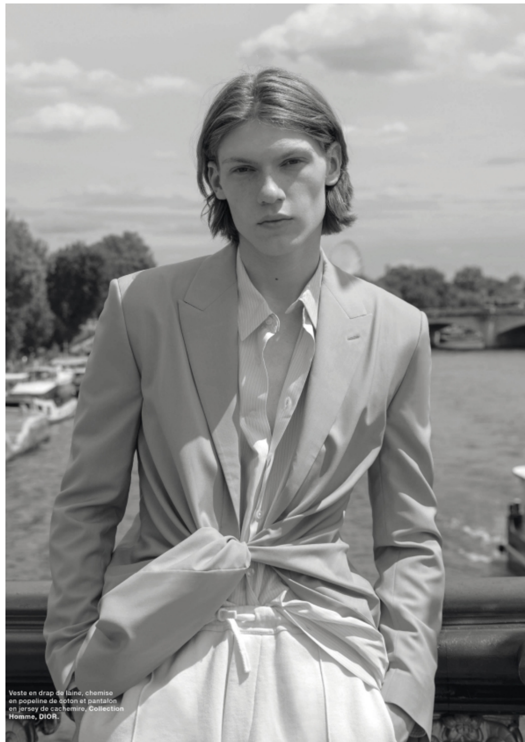
Veste en drap de laine, chemise en popeline de coton et pantalon en jersey de cachemire, Collection Homme, DIOR.