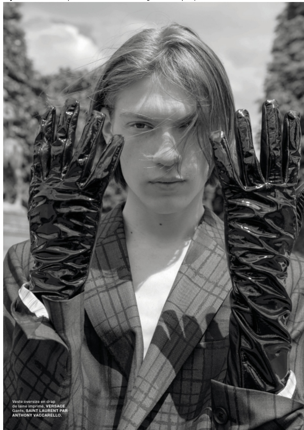
Veste oversize en drap de laine imprimé, VERSACE. Gants, SAINT LAURENT PAR ANTHONY VACCARELLO.