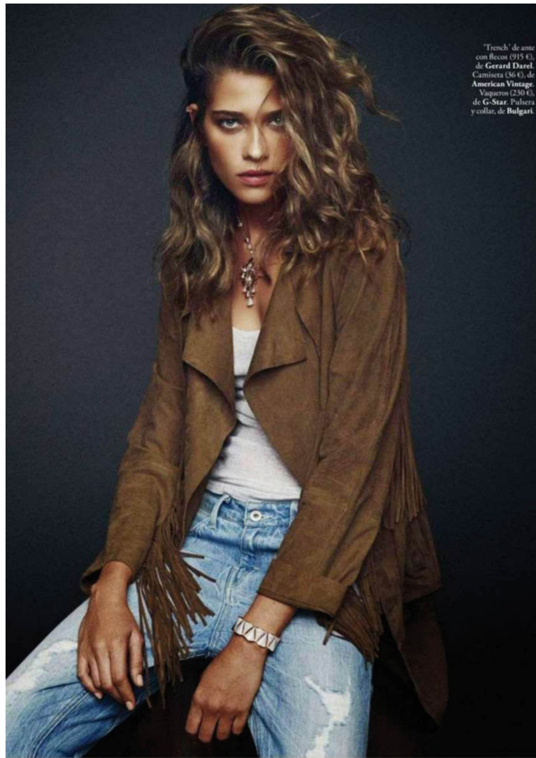
'Trench' de ante con flecos (915 €), de Gerard Darel . Camiseta (36 €), de American Vintage . Vaqueros (230 €), de G-Star . Pulsera y collar, de Bulgari .