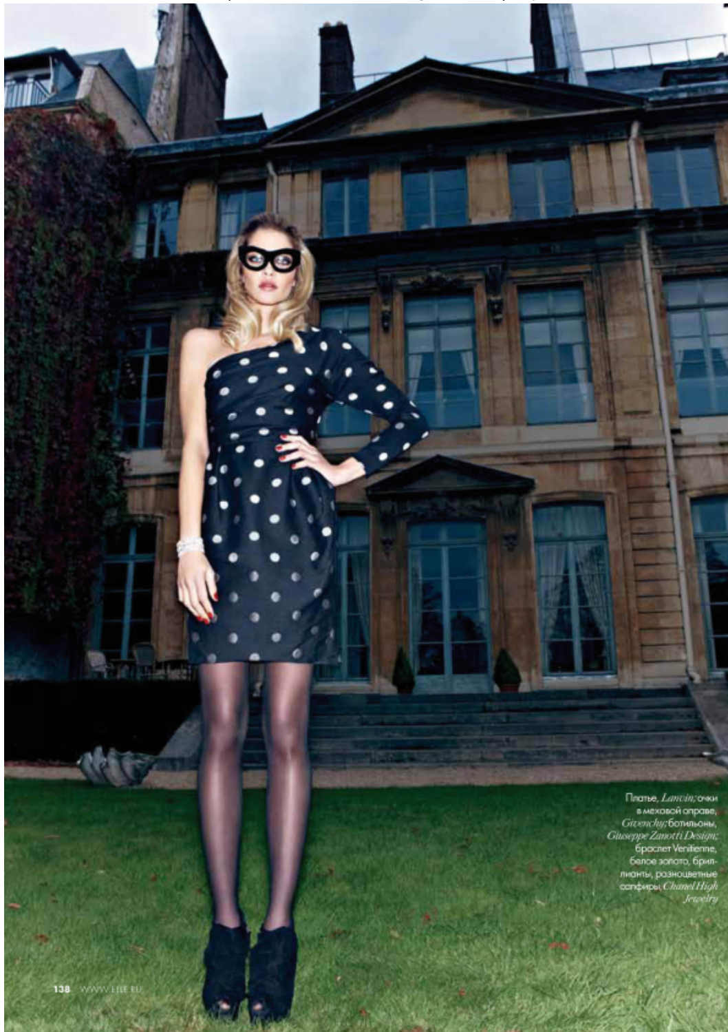
Платье, Lanvin ; очки в меховой оправе, GivENCHY ; ботильоны, Giuseppe Zanotti Design ; браслет Verlaine , браслет золота, брил- лианты, разноцветные сапфиры, Chanel High Jewelry