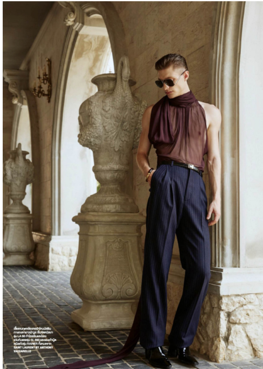
เสื้อคอสูงสีม่วงเข้ม ราคาอยู่ที่ 400 ยูโร กางเกงสีน้ำเงินเข้ม ราคาอยู่ที่ 600 ยูโร รองเท้าหนังสีดำ ราคาอยู่ที่ 200 ยูโร โดย SAINT LAURENT BY ANTHONY VACCARELLO