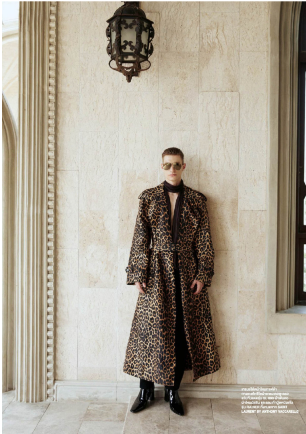
เสื้อโค้ทยาวสีลายแมวป่า ราคาอยู่ที่ 800 ยูโร สูทสีน้ำเงินเข้ม ราคาอยู่ที่ 600 ยูโร รองเท้าหนังสีดำ ราคาอยู่ที่ 200 ยูโร โดย SAINT LAURENT BY ANTHONY VACCARELLO