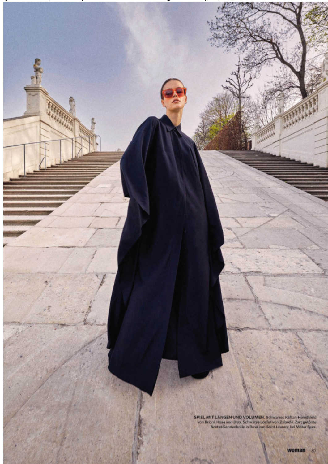
SPIEL MIT LÄNGEN UND VOLUMEN. Schwarzes Kaftan-Hemdkleid von Brioni. Hose von Brox. Schwarze Loafer von Zolando. Zart getönte Acetat-Sonnenbrille in Rosa von Saint Laurent bei Mister Spex.