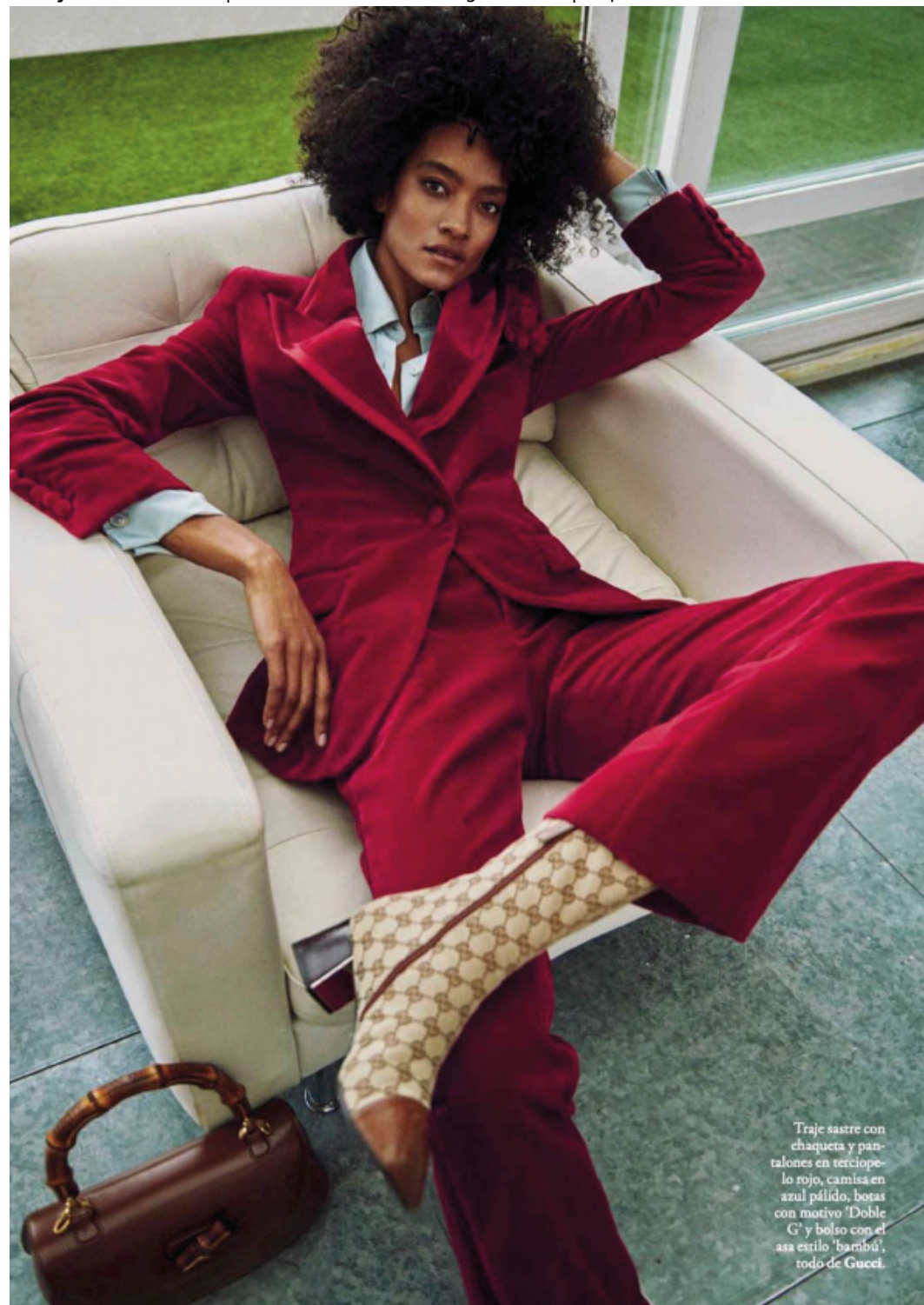
Traje sastre con chaqueta y pantalones en terciopelo rojo, camisa en azul pálido, botas con motivo 'Doble G' y bolso con el asa estilo 'bambú', todo de Gucci.