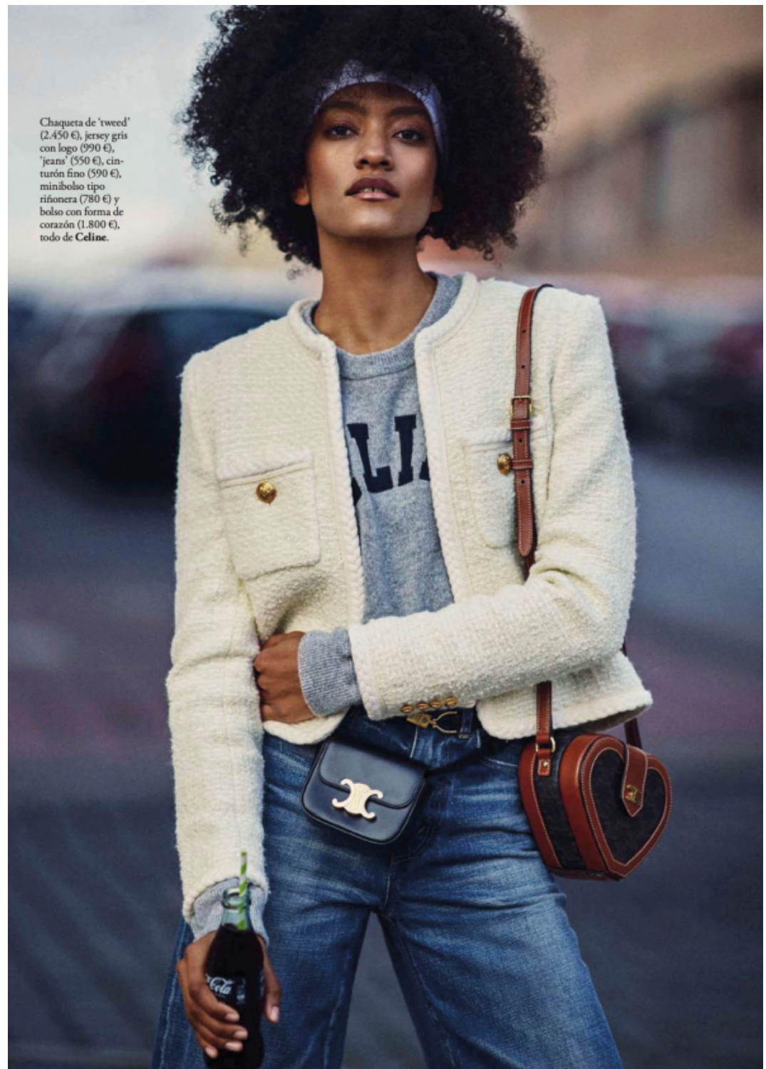
Chaqueta de 'tweed' (2.450 €), jersey gris con logo (990 €), 'jeans' (550 €), cinturón fino (590 €), minibolso tipo riñonera (780 €) y bolso con forma de corazón (1.800 €), todo de Celine.