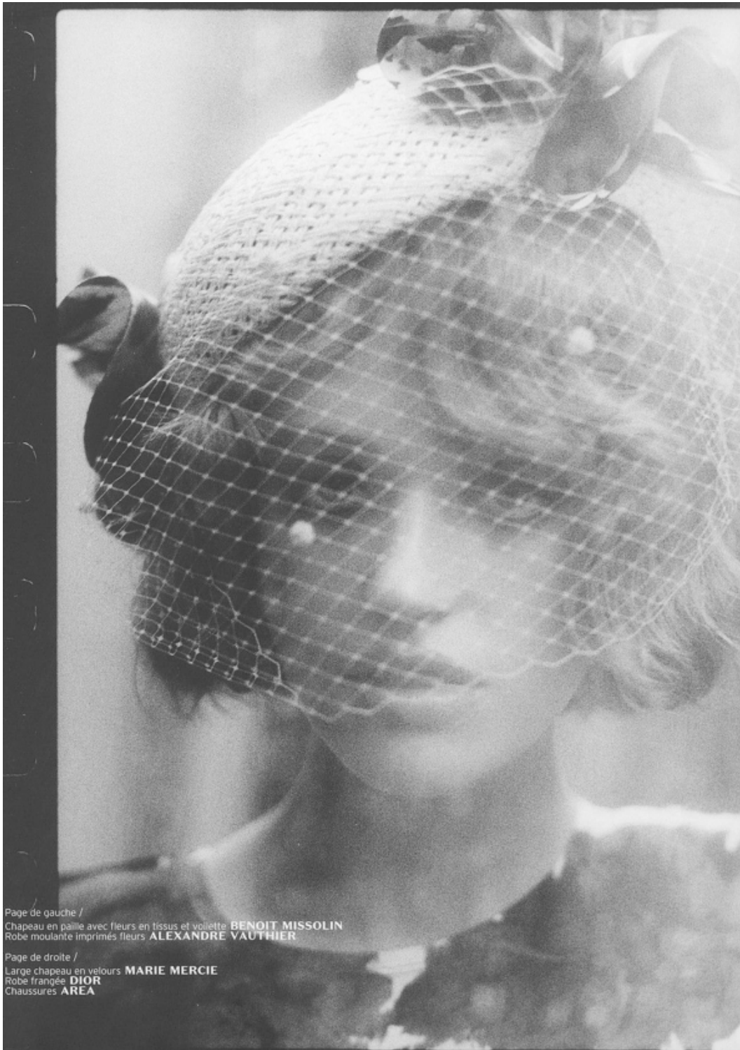
Page de gauche / Chapeau en paille avec fleurs en tissus et voilette BENOIT MISSOLIN Robe moulante imprimés fleurs ALEXANDRE VAUTHIER