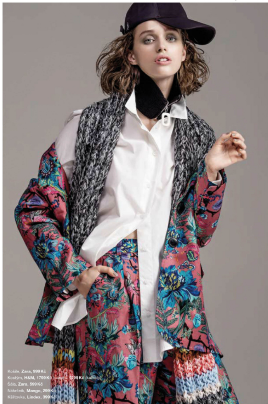
Košile, Zara, 999 Kč Kostým, H&M, 1799 Kč (sako) a 1299 Kč (kalhoty) Šála, Zara, 599 Kč Nákrčník, Mango, 299 Kč Kšiltovka, Lindex, 399 Kč