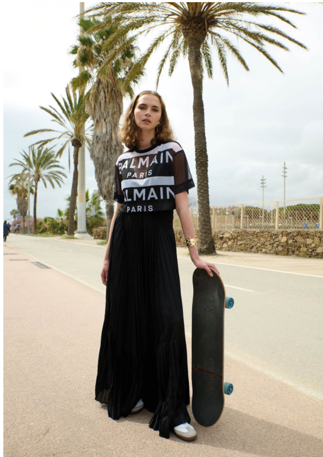
T-shirt Balmain. Haljina Dries Van Noten. Tenisice adidas. Naušnice By Coco. Narukvice LaCroix