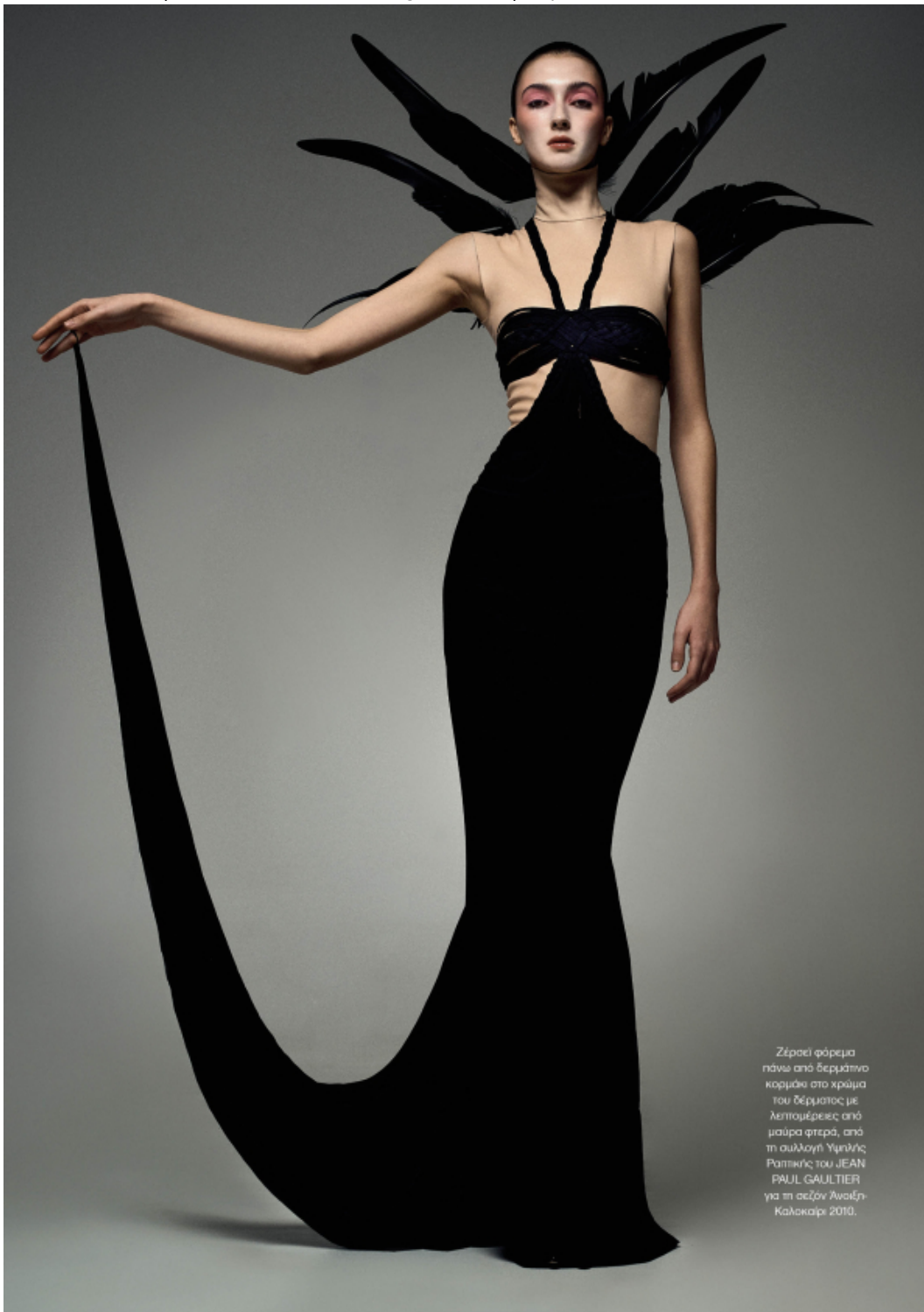
Ζέρσεϊ φόρεμα πάνω από δερμάτινο κορμάκι στο χρώμα του δέρματος με λεπτομέρειες από μαύρα φτερά, από τη συλλογή Υψηλής Ραπτικής του JEAN PAUL GAULTIER για τη σεζόν Άνοιξη-Καλοκαίρι 2010.