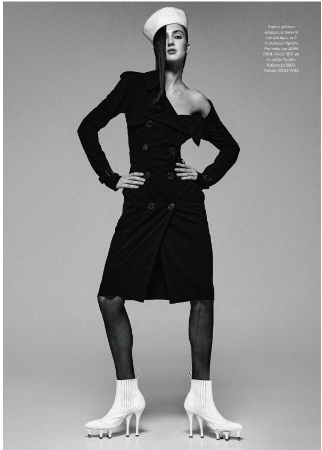
Σέρσεϊ μαλλινο φόρεμα με ανοικτό τον ένα ώμο, από τη συλλογή Υψηλής Ραπτικής του JEAN PAUL GAULTIER για τη σεζόν Άνοιξη-Καλοκαίρι 2000, Καλοάν WOLFORD.