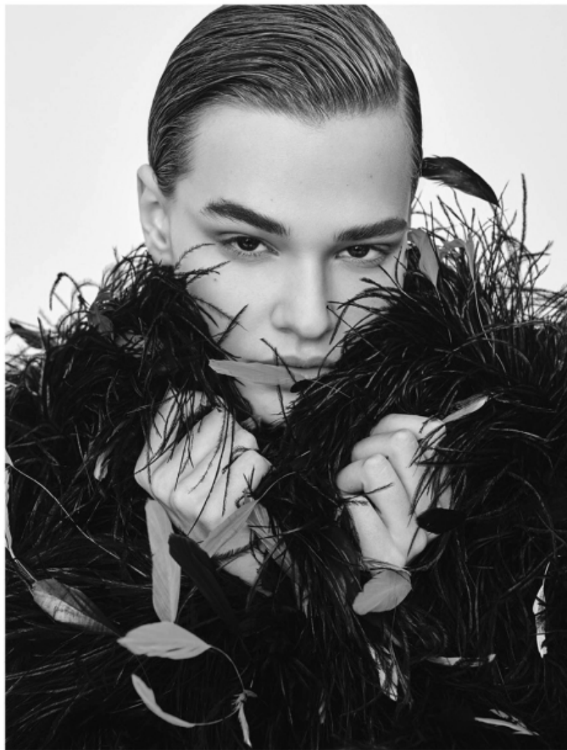
Пальто из тюля и перьев страуса, MAISON BOHEMIQUE

MAISON BOHEMIQUE — НЕ ОГРОМНАЯ КОМПАНИЯ, А ЭКСПЕРИМЕНТАЛЬНАЯ СТУДИЯ. И В ЭТОМ ПЛАНЕ НАМ БЛИЖЕ ВСЕГО ФИЛОСОФИЯ АЗЗЕДИНА АЛАЙИ