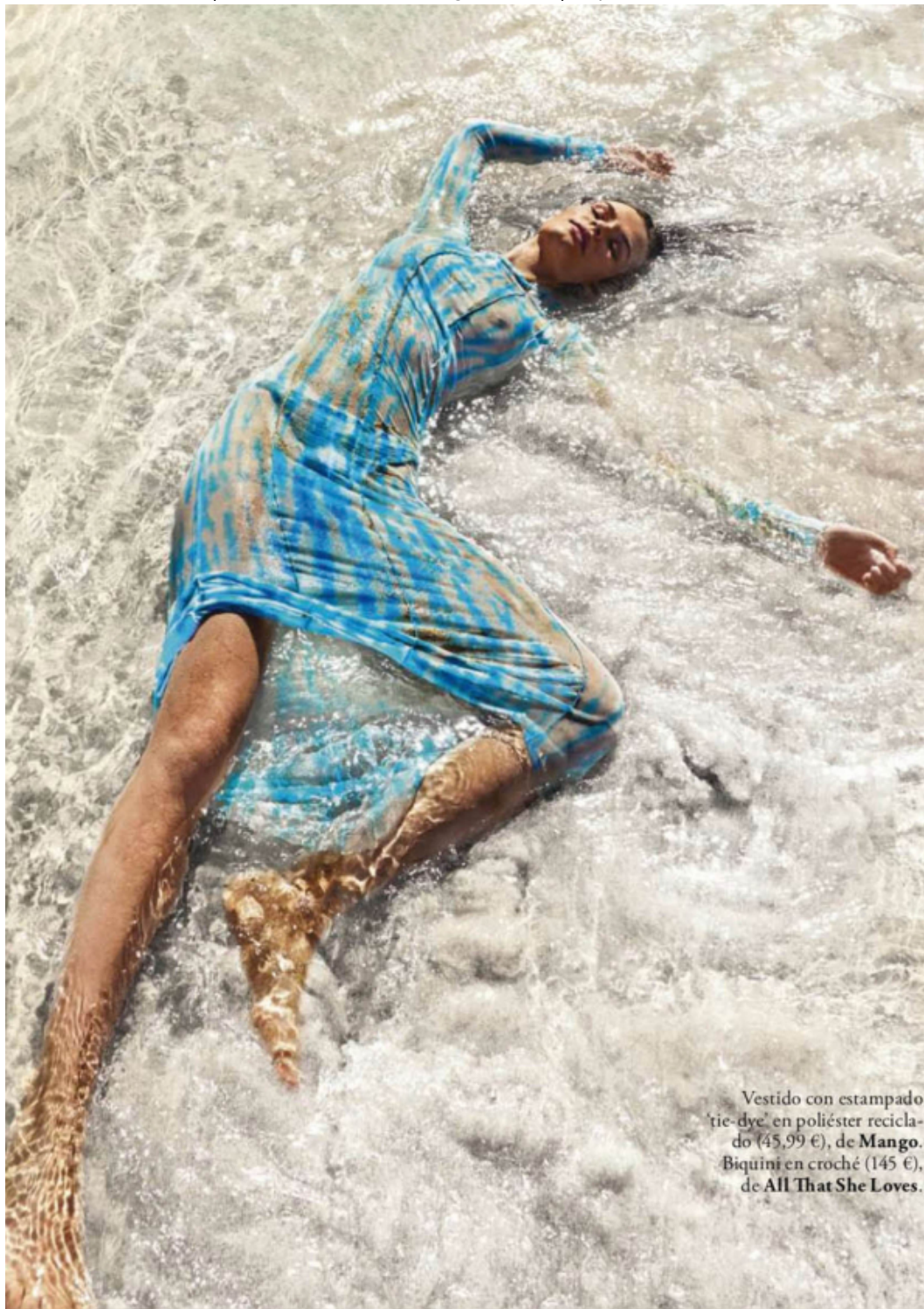
Vestido con estampado tie-dye en poliéster reciclado (45,99 €), de Mango. Biquini en croché (145 €), de All That She Loves.