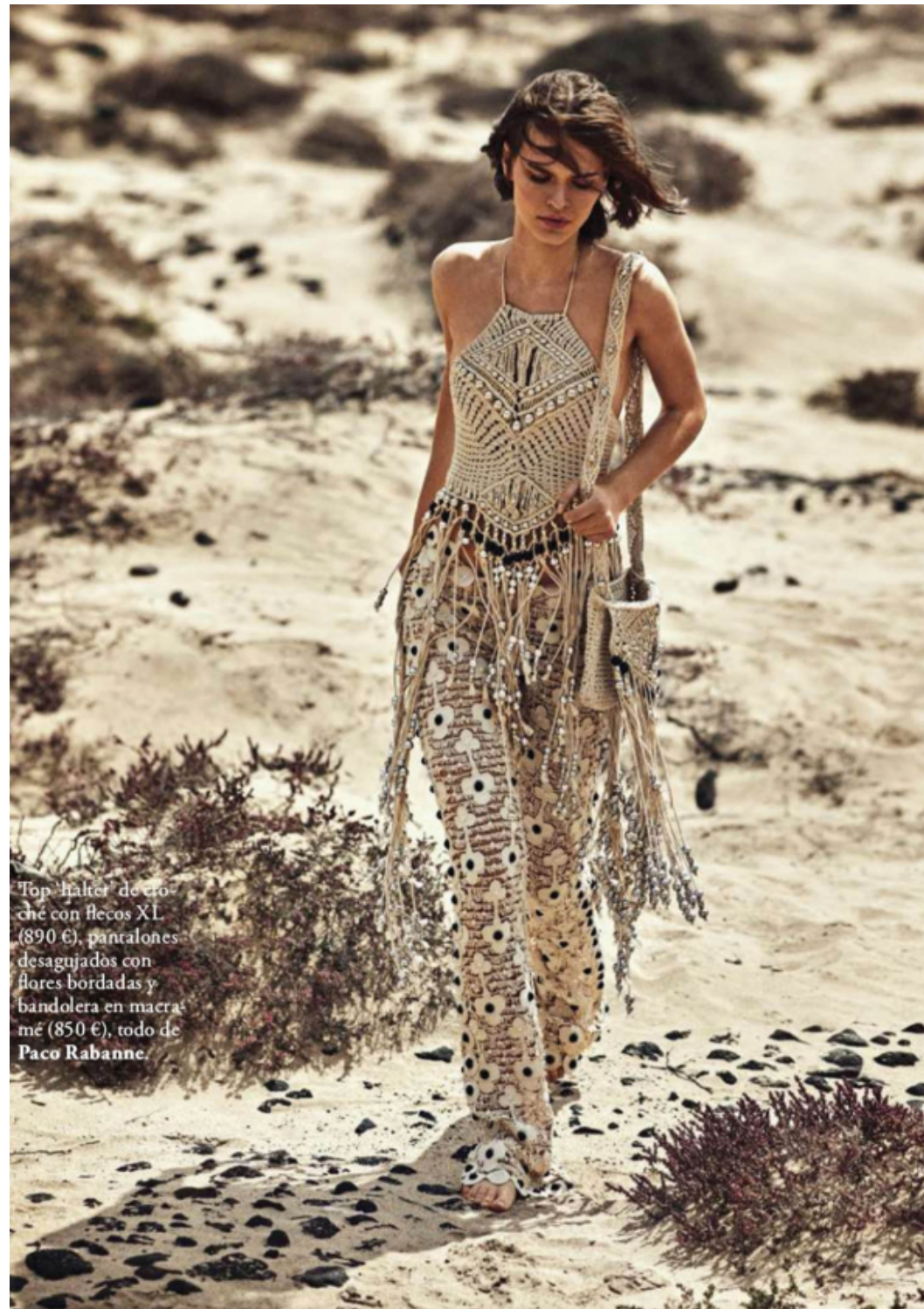
Top halter de croché con flecos XL (890 €), pantalones desagujados con flores bordadas y bandolera en macramé (850 €), todo de Paco Rabanne.