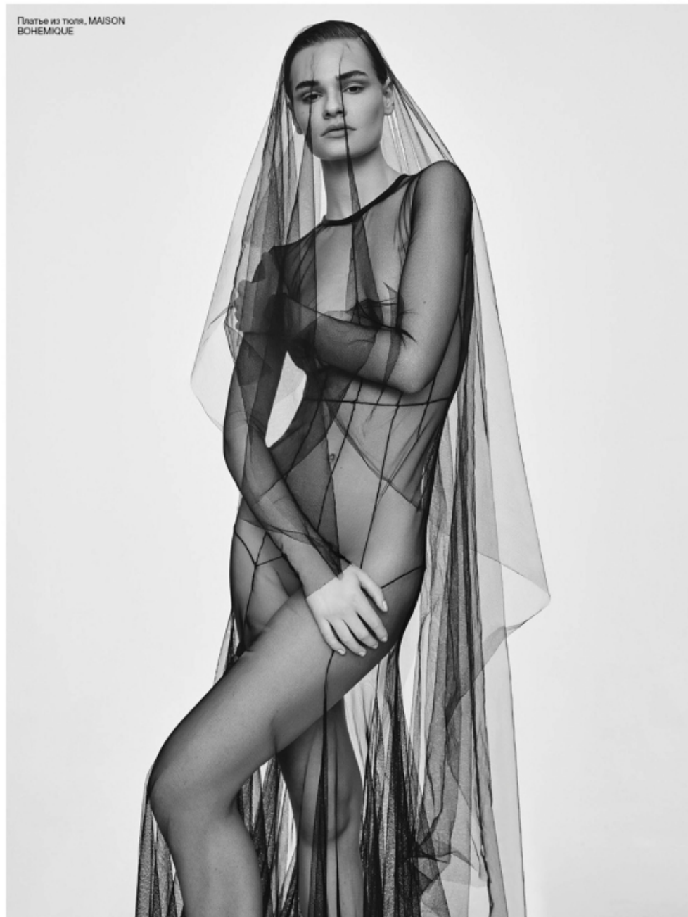
Пальто из тюля, MAISON BOHEMIQUE

СТИЛЬ: ЕКАТЕРИНА САСИНА; МОДЕЛЬ: LIZA MINICHEVA @V PROJECT MODELS; МАКІЯЖ: ANDREY SHUKOV; ПРИЧЕСКА: MARIA MUTTSYNA; ГРАФИКЕ: ROMAN MOKROGOZOV; МАНИКЮР: ELENA CHERVAKOVA; АССИСТЕНТ СТИЛИСТА: LIZA SHISHKINA; АССИСТЕНТ МОДЕЛИ: MOSCOW; ПРОДЮСЕР: ELENA SEROVA; АССИСТЕНТ ПРОДЮСЕРА: SVETLANA SUZDALEVA