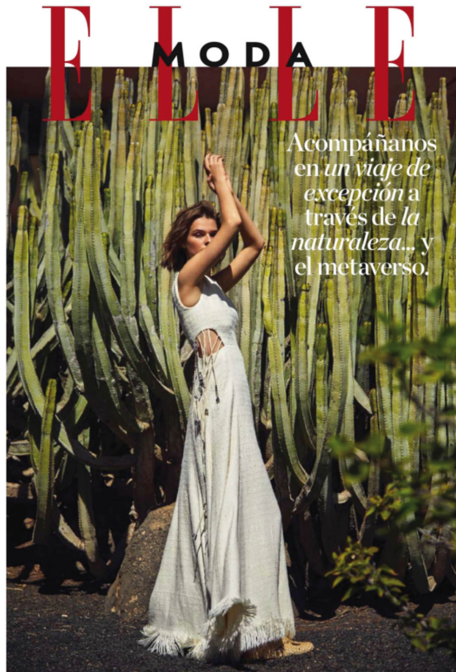
REALIZACIÓN: BÁRBARA GARRALADA Y SYLVIA MONTOLÍ. VESTIDO 'QUIT' CON FLECOS DE CHLOÉ Y BABLOHAS DE RAFI DE PLASIKES.

En la otra pág.: triquini con textura y nudo (35,99 €), de Énfasis para El Corte Inglés . Gargantilla trenzada (462 €), de Elisabetta Franchi .