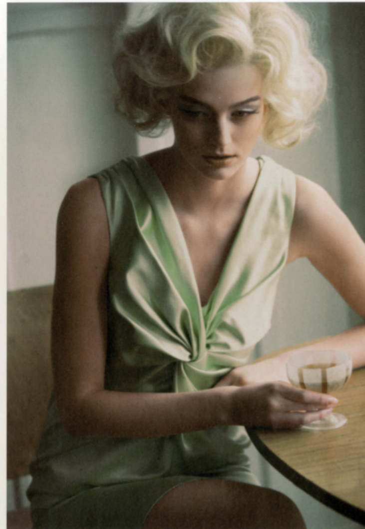
Links Bluse von YIORGOS ELEFThERIADES. Rechts Kleid von BURBERRY PRORSUM.