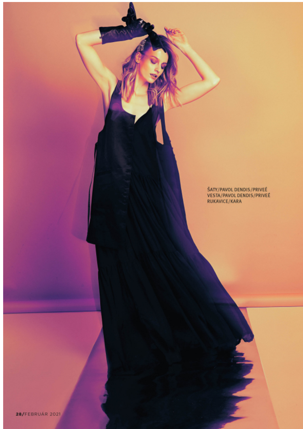
ŠATY/PAVOL DENDIS/PRIVEÉ VESTA/PAVOL DENDIS/PRIVEÉ RUKAVICE/KARA