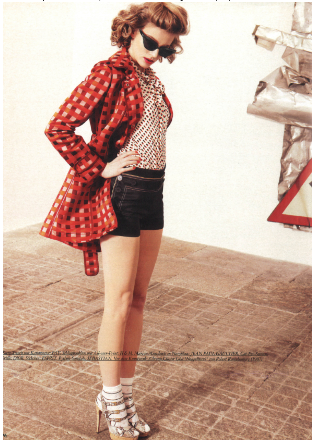
Strada: Dress mit Karomuster: F&A; Schlagpfeil mit All-over-Print; H&M; Matrye-Minihals in Navy/Blau; JEAN PAUL GAULTIER, Cat-Fox-Sonnenbrille; DMAR, Stöckchen; ESPRIT; Pyjama-Satinsatze; SEBASTIAN. Vor dem Karntauer „Glossare Cluster Glut (Neapolitan)“ von Roland Ranzbacher (1987)