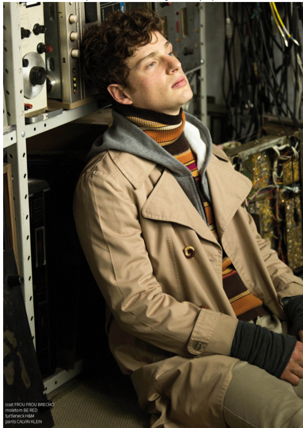
coat FROU FROU BRECHO moletom BE RED turtleneck H&M pants CALVIN KLEIN