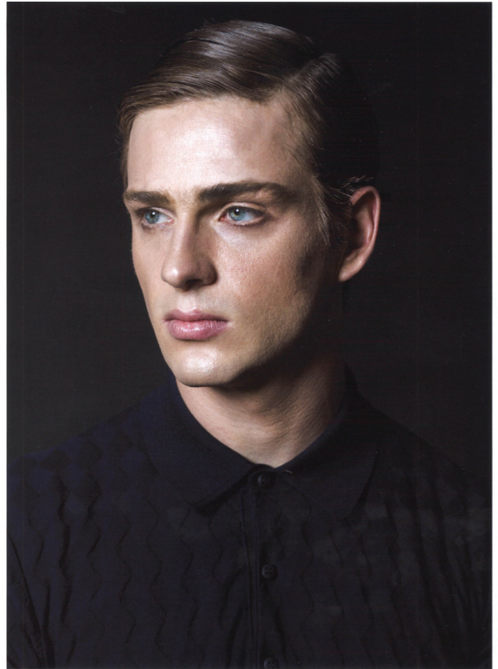
Ballantyne polo shirt. Opposite page, from left, Canali jacket and trousers, Rocco P. shoes; Herno jacket, Patrizia Pepe shirt, Christopher Kane trousers, a.testoni shoes.